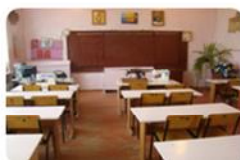
кабинет технологии для девочек